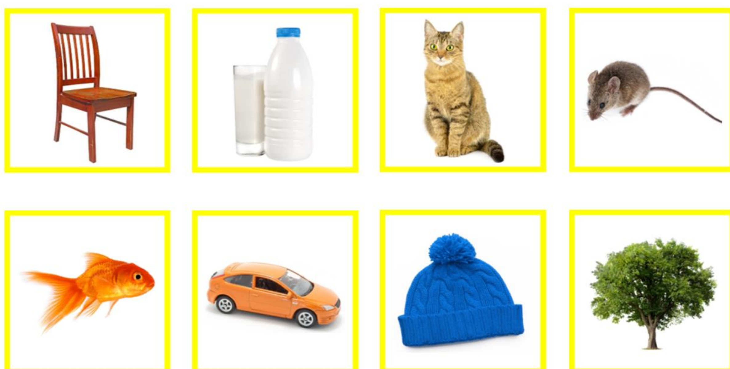
Deel van de gekozen woorden/plaatjes voor de Spaanse versie van Speakaboo